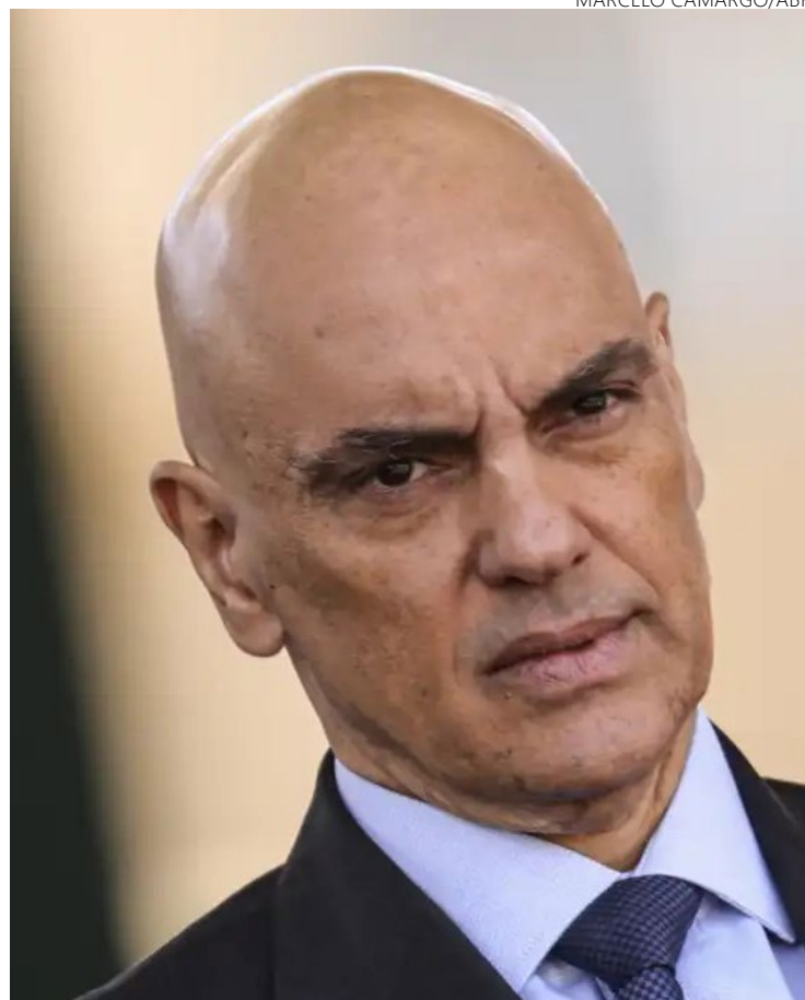
Moraes: ministro enviou em 19 de fevereiro uma ordem para a Justiça Federal