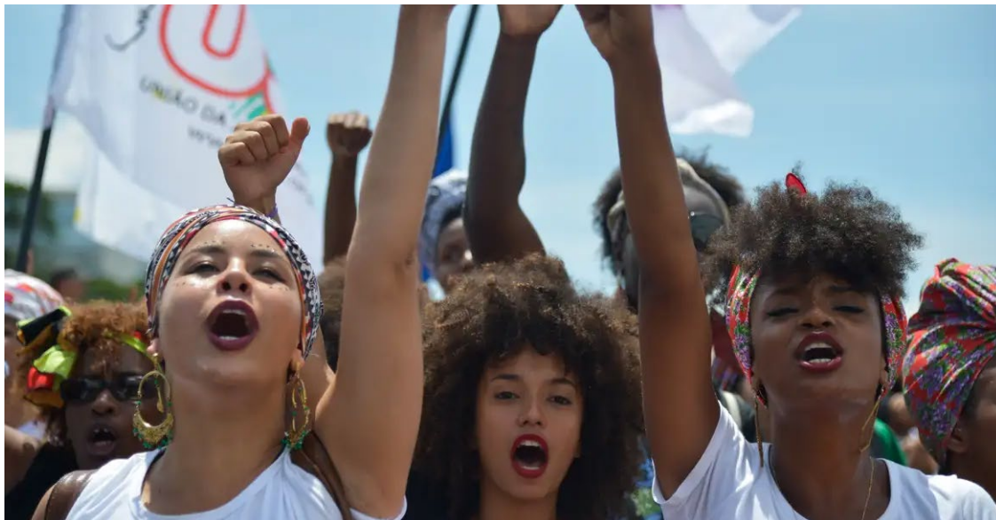
Quase um quarto dos governos em todo o mundo relataram retrocessos nos direitos das mulheres

Trinta anos após a criação da maior agenda global para alcançar a igualdade de direitos para mulheres, desigualdade ainda é grande em muitos países