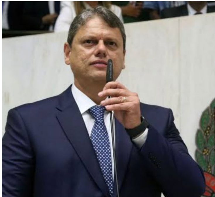
Tarcísio de Freitas, governador de São Paulo: negociação beneficia governo estadual e parlamentares

De um lado, o grupo decidiu destinar todas as suas emendas federais de R$ 316 milhões exclusivamente a