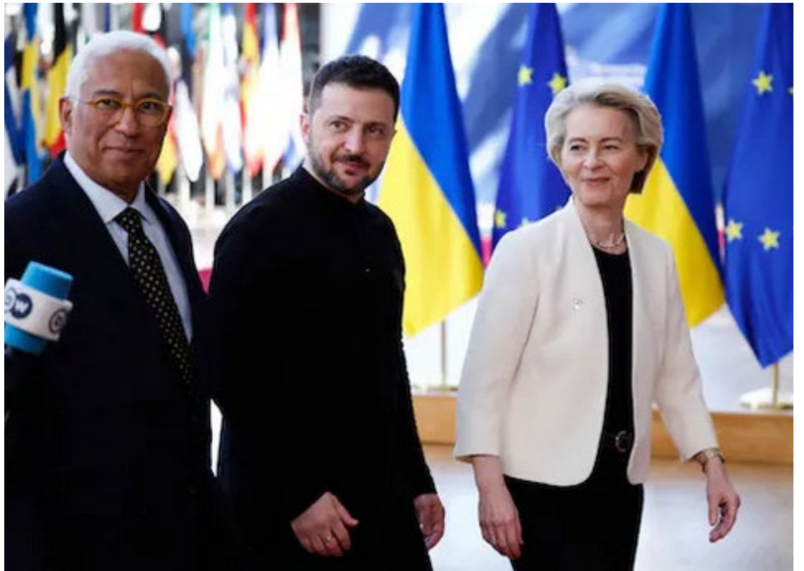
Chefe da diplomacia europeia, Antonio Costa; presidente ucraniano Volodymyr Zelensky e a presidente da Comissão Europeia, Ursula von der Leyen

Apesar dos esforços diplomáticos em curso, incluindo conversas mediadas pela Arábia Saudita e Turquia, o conflito continua intenso. A Rússia reivindicou recentemente a captura de mais uma localidade no le-