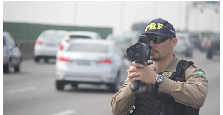
Dados foram divulgados nesta quinta-feira na sede da PRF em Brasília

Entre os dias 28 de fevereiro e 5 de março, foram contabilizados 83 óbitos em rodovias federais contra 88 no carnaval de 2024