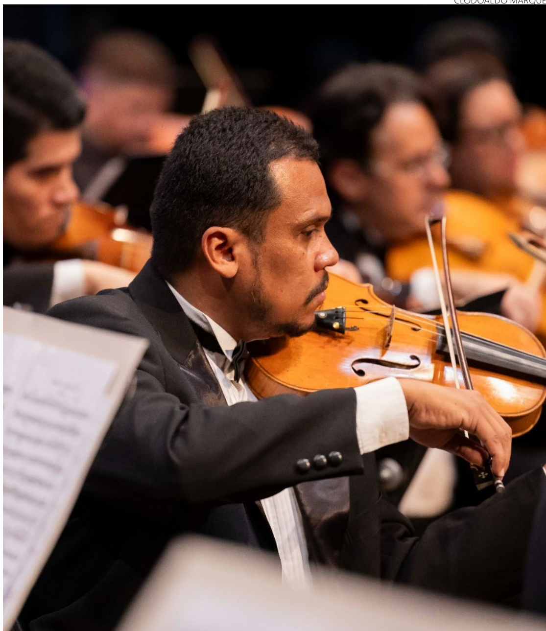
Músicos realizarão espetáculo com repertório orquestral escrito por mulheres: homenagem ao dia 8 de março