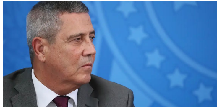
Data final para a apresentação da defesa por Braga Netto

Advogados do general Braga Netto voltaram a pedir ao Supremo Tribunal Federal (STF) a ampliação do prazo para a apresentação da defesa