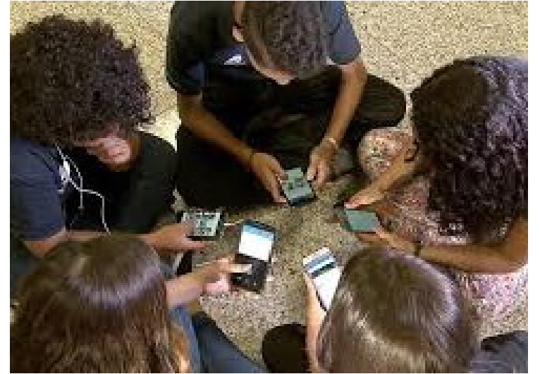
Uso de celulares é permitido apenas para fins pedagógicos

Aprovada em janeiro, legislação proíbe o uso indiscriminado de celulares e tablets em escolas públicas e privadas